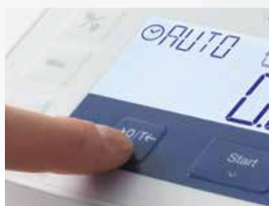
1. Trừ bì cân.

Phân tích độ ẩm chưa bao giờ dễ dàng đến vậy, chỉ theo dõi các chỉ dẫn trên màn hình, và kết quả sẽ thu được chỉ trong vài phút