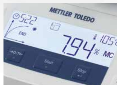
3. Nhấn nút start. Xem kết quả trên màn hình sau vài phút.