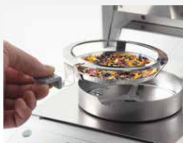
2. Thêm mẫu và trải đều trên bề mặt đĩa.